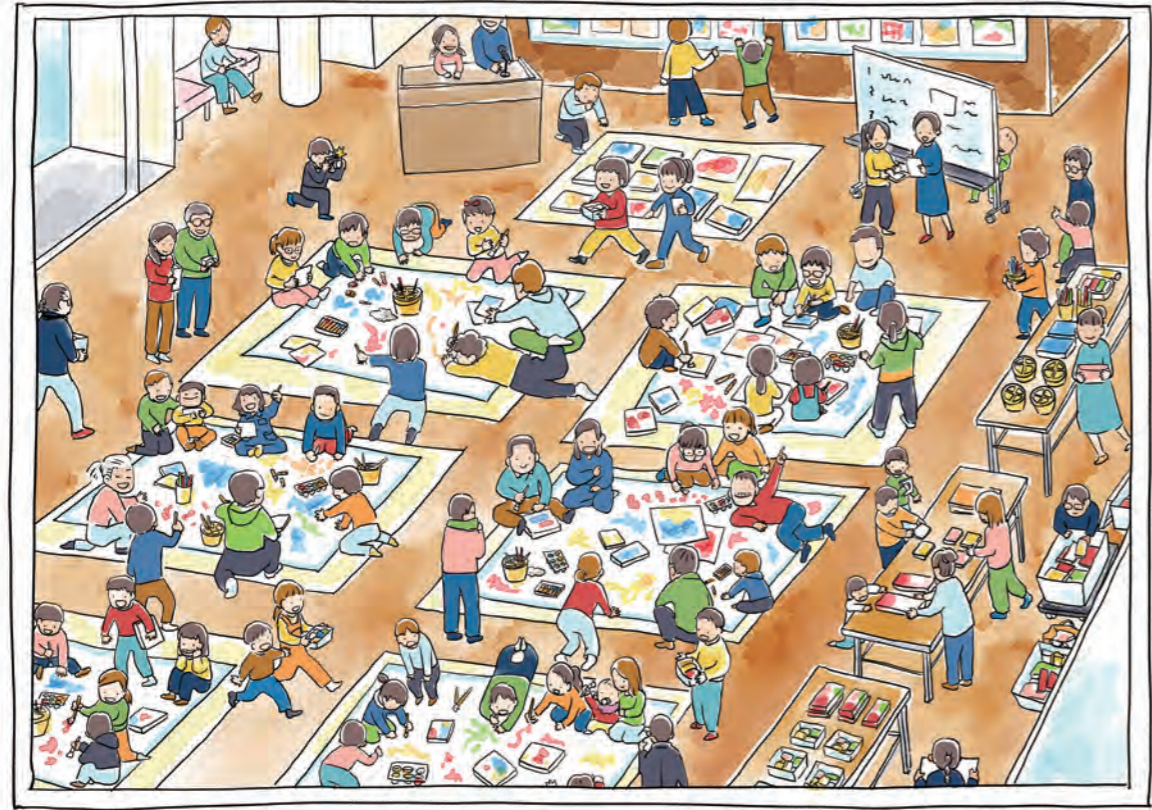
イラスト：マツナガマサエ